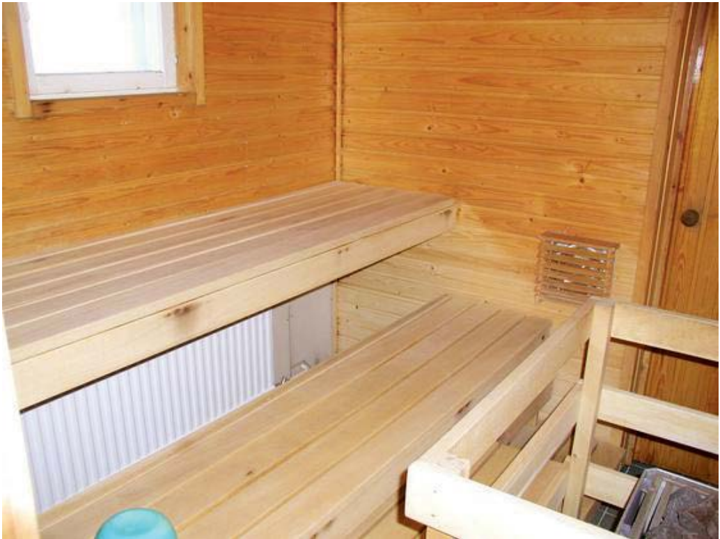
Kuvan sauna ei liity tapaukseen

Myös Domus Gaudiumin Osakunnat kärsivät varaustappioita, sillä tavanomainen keväinen saunailta jäi tällä kertaa pitämättä. Kattosaunan tilat palautuvat Helsingin yliopiston ylioppilaskunnan hallintaan, mutta ne ovat poissa käytöstä kunnes konkurssiin liittyvät asiat on selvitetty ja HYY on saanut päätetyksi miten Sivistyksen käytännön asiat järjestetään jatkossa. Tätä kirjoittaessa ei ole vielä tiedossa, onko syksyllä mahdollista järjestää perinteisiä DGO:n saunailtoja.