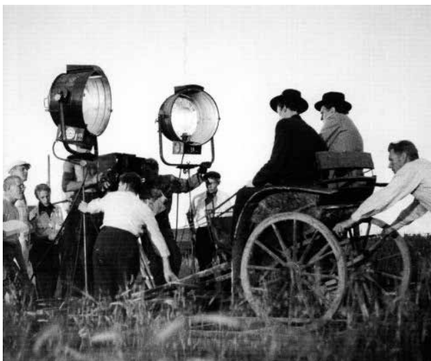
Kuvituskuva, Lähde: Meri Lauri: Tauno Pauli. Helsinki: Otava, 2008

Suomen ensimmäinen ja vanhin yleinen uimahalli on tunnettu siitä, että perinteisesti siellä on uitu alasti. Naisilla ja miehillä on Yrjönkadulla omat uintivuoronsa. Klassista arkkitehtuuria edustavassa upeassa tilassa on kaksi kerrosta, joista alemmasta löytyvät pukukaapit ja allas. Toisesta kerroksesta voi ostaa itselleen tyylikkäästi oman lepohtin ja tilata kahvilasta virvokkeita elähdyttäneen kroolaukokokemuksen päätteeksi ja elää oman elämänsä "jo muinaiset roomalaiset" -hetken.