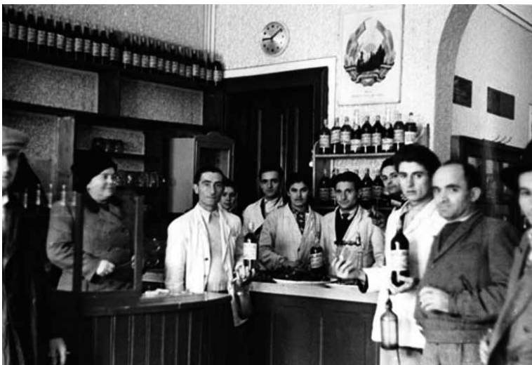
Kuvituskuva, Lähde: Communism in Romania Photo Collection

Helsingin ydinkeskustan burgervaihtoehto Sky Expressille ja Barbarossalle. Kohtuuhintaiset ja hyvät burgerit ja pari mukavaa sohvaa kattava sisustus. Miinuspuolena on pienehkö tila, joka muuttuu päiväsaikaankin täynnä ollessaan helposti meluisaksi.